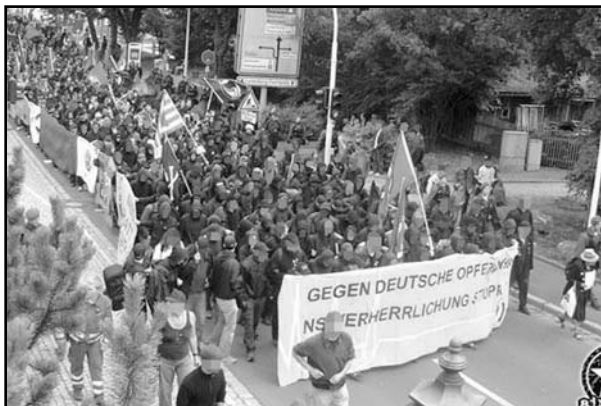
Antifa διαδήλωση, 2004. Στη Γερμανία, η διάταξη στο δρόμο είναι σημαντική.

φος. Η πτώση του τείχους το 1990 (κρατήστε το αυτό, θυμίζει τα δικά μας) αποτέλεσε ένα σημείο αναφοράς, που έφερε στο προσκήνιο όχι τους αυτόνομους αλλά τους φασίστες! Ο (γερμανικός) κόσμος άλλαξε ραγδαία δίχως μια πειστική εξήγηση και ανάλυση από τους αυτόνομους. Μια κατάλληλη αφορμή την κατάλληλη ώρα - η κατάκτηση του μουντιάλ