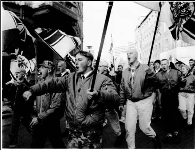
Πορεία νεοναζί στην Halle της πρώην Ανατολικής Γερμανίας, 11/1995. Στις εκλογές που ακολούθησαν, το κόμμα τους (Γερμανική Λαϊκή Ένωση) κόνόμησε το 12,9% των ψήφων.

Πάντως τα γεγονότα είναι αρκετά ωμά ώστε να μην επιδέχονται και πολλή κοινωνιολογική ανάλυση. Ο Μάιος του 1991 είναι ενδεικτικός για να πάρει κανείς μια ιδέα του τί σήμαινε "εμφάνιση των νεοναζί στη Γερμανία των αρχών της δεκαετίας του '90". Εκείνο το μήνα, στο Wittenberg, μια ομάδα ναζιστών πέταξε δύο πρόσφυγες από τη Ναμίμπια από τον πέμπτο όροφο του ασύλου όπου διέμεναν. Στη Δρέσδη, μια ομάδα φασιστών επιτέθηκε σε ένα σπίτι όπου έμεναν 40 παιδιά θύματα του ατυχήματος του Chernobyl που βρίσκονταν στη Γερμανία για θεραπεία. Οι φασίστες έσπασαν τα τζάμια του κτιρίου όπου διέμεναν τα παιδιά και πέταξαν αναμμένους πυρσούς στο εσωτερικό. Μόνο το βράδυ της 6ης Μαΐου συνέβησαν τα εξής: Στο Ανόβερο, πενήντα φασίστες επιτέθηκαν σε Τούρκους νεολαίους. Ένας φασίστας τραυματίστηκε από πιστόλι φωτοβολίδων που του άναψε στα μούτρα κάποιος από τους Τούρκους. Στο Schessel, μια κατάληψη των αυτόνομων δέχτηκε επίθεση από νεοναζί. Την ίδια μέρα στο Kiel μια άλλη κατάληψη δέχτηκε επίθεση και οι ναζί αποχώρησαν μετά από μάχη σώμα με σώμα. Αργότερα τον ίδιο μήνα, μια κατάληψη του Ανατολικού Βερολίνου δέχτηκε επίθεση από νεοναζί μέσα στη νύχτα. Πολλοί από τους κατα-