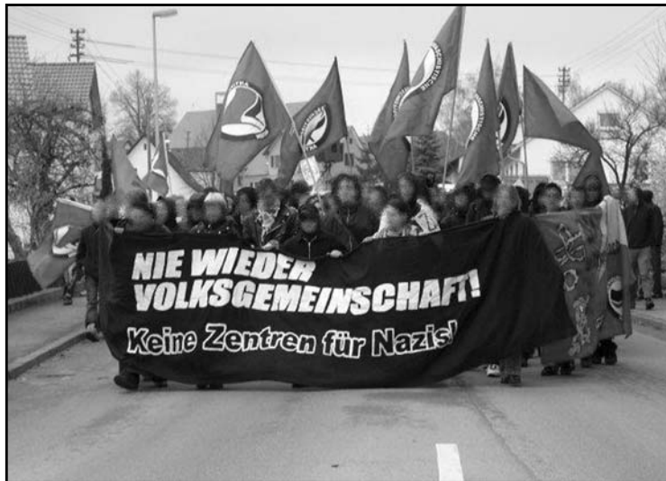
Το είπαμε; Στη Γερμανία, η διάταξη στο δρόμο είναι σημαντική...

Φυσιολογικά βέβαια η αντίληψη αυτή δε θα μπορούσε να είναι άμοιρη συνεπειών. Το αντιρατσιστικό κίνημα (που κατά κάποιο τρόπο αποτελεί μια μετεξέλιξη του κλασικού antifa κινήματος) έτσι όπως περιγράφεται στο δεύτερο από τα κεφάλαια που