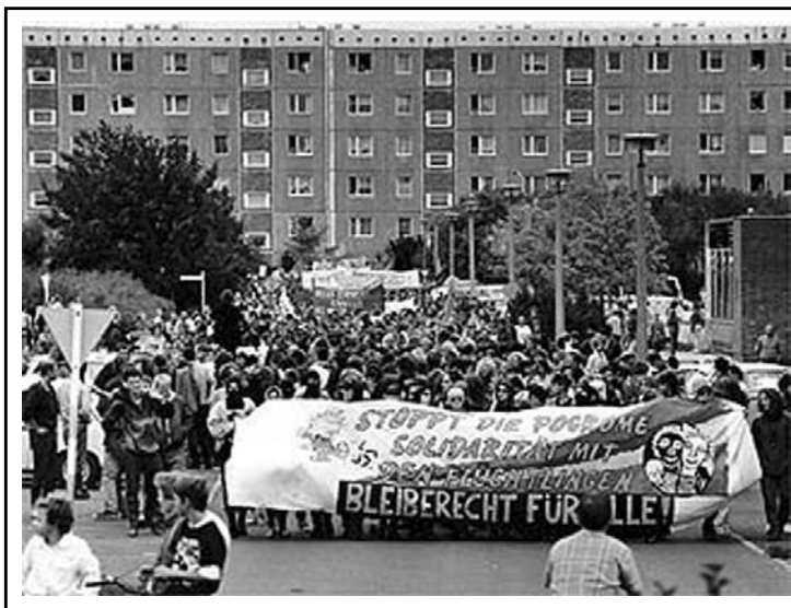
Antifa διαδήλωση μετά το πογκρόμ στο Rostock.

Όπως και να το κάνεις, όταν πρόκειται για ναζιστές, οι μπάτσοι όλο και κάτι παραπάνω ξέρουνε. Όχι μόνο οι μισοί Γερμανοί μπάτσοι ήταν ψηφοφόροι του ακροδεξιού ρεπουμπλικανικού κόμματος, αλλά και το ίδιο το γερμανικό κράτος υποστήριζε τη δράση των ακροδεξιών με τον τρόπο του. Δεν είναι μόνο η θρυλική ρήση του καγκελάρου Kohl σύμφωνα με την οποία "Η Γερμανία δεν είναι χώρα μεταναστών". Υπάρχουν και περιστατικά όπου οι ναζιστικές επιθέσεις έτυχαν ημιεπίσημης κρατικής στήριξης. Παράδειγμα: Όπως θα δούμε να αναφέρεται και στο κυρίως κείμενο, το πρώτο μεγάλο μεγέθους πογκρόμ μετά την επανένωση των Γερμανιών έλαβε χώρα