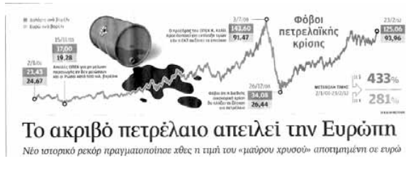
Διάγραμμα 2: Τιμές του πετρελαίου από το 2001 μέχρι το 2012.

Ειδικά το διάγραμμα 1 είναι εξαιρετικά διαφωτιστικό. Εκεί σημειώνονται οι κορυφώσεις της τιμής του πετρελαίου που σημειώθηκαν κατά τη διάρκεια της πρώτης και της δεύτερης πετρελαϊκής κρίσης (από το 1973 έως το 1979 και από το 1980 έως το 1985 αντίστοιχα). Από τη δεύτερη πετρελαϊκή κρίση και μετά, η τιμή του πετρελαίου σταθεροποιείται σε επίπεδα που λίγα χρόνια πριν θεωρούνταν “επίπεδα κρίσης” με την εξαίρεση του άλματος στην τιμή του πετρελαίου που αντιστοιχεί στον πρώτο πόλεμο του κόλπου το 1991. Είναι ενδιαφέρον που η έναρξη της επόμενης αυξητικής πορείας της τιμής του πετρελαίου συμπίπτει με την εισβολή των ΗΠΑ στα Βαλκάνια το 1999, αφού, όπως όλοι ξέρουμε, ούτε εκεί έχει πετρέλαιο. Τελικά πάντως, όπως βλέπουμε στο διάγραμμα 2, η μεγάλη εκτόξευση της τιμής του πετρελαίου από το 2001 και μετά (αύξηση 433% σε δολάρια και 281% σε ευρώ) αντιστοιχεί ακριβώς στην περίοδο του “πολέμου κατά της τρομοκρατίας”. Σήμερα οι τιμές του πετρελαίου βρίσκονται σε επίπεδα που κάνουν ακόμη και τις τιμές της δεύτερης πετρελαϊκής κρίσης να φαντάζονται νάνοι.