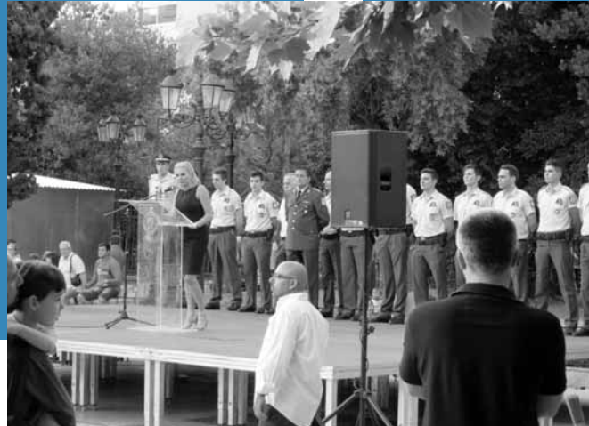
Το σετ «μπάτσοι τιβι τακούνι μπικουτί» που λέγαμε. Ο διοικητής του Α.Τ. Καλλιθέας, οι μπάτσοι της γειτονιάς και η δημοσιογράφος γλάστρα της εκδήλωσης.

πολιτικής νεολαίας και ταυτόχρονα η ενίσχυση της σχέσης της αστυνομίας με τα φιλήσχα στοιχεία στις κατά τόπους γειτονιές. Η δεκαετία του 1980 ήταν η εποχή όπου διεθνώς, αλλά και στην Ελλάδα, η έννοια «εγκληματικότητα» εισήλθε στο λεξιλόγιο των κοινωνιολόγων, των πολιτικών, των μμε, με το πολυμασημένο επιμύθιο ότι «η εγκληματικότητα αυξάνει». Την ίδια επίσης περίοδο, αναδύθηκε η «μάστιγα των ναρκωτικών» ως συστατικό στοιχείο της προπαγανδιστικής εκστρατείας για την αναγκαιότητα επιβολής του νόμου στην καθημερινότητα σε 24ωρη βάση.