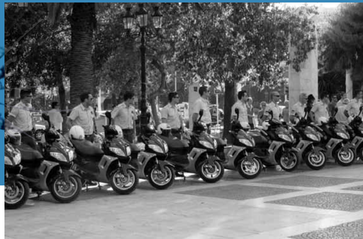
Το πρόσωπο της σύγχρονης «κοινοτικής αστυνόμευσης» απαθανατίζεται στον φακό. Το πρόσωπο προφανώς έπρεπε να πληροί συγκεκριμένες προδιαγραφές: σχετικά νεαρός και γλυκούλης, δεκτά και τα γυαλιά μυωπίας.