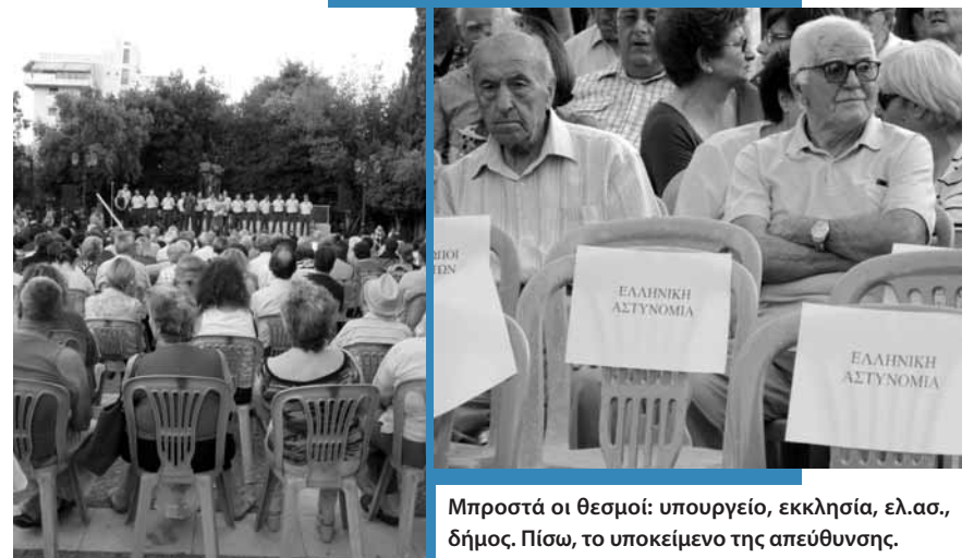
Μπροστά οι θεσμοί: υπουργείο, εκκλησία, ελ.ασ., δήμος. Πίσω, το υποκείμενο της απεύθυνσης.